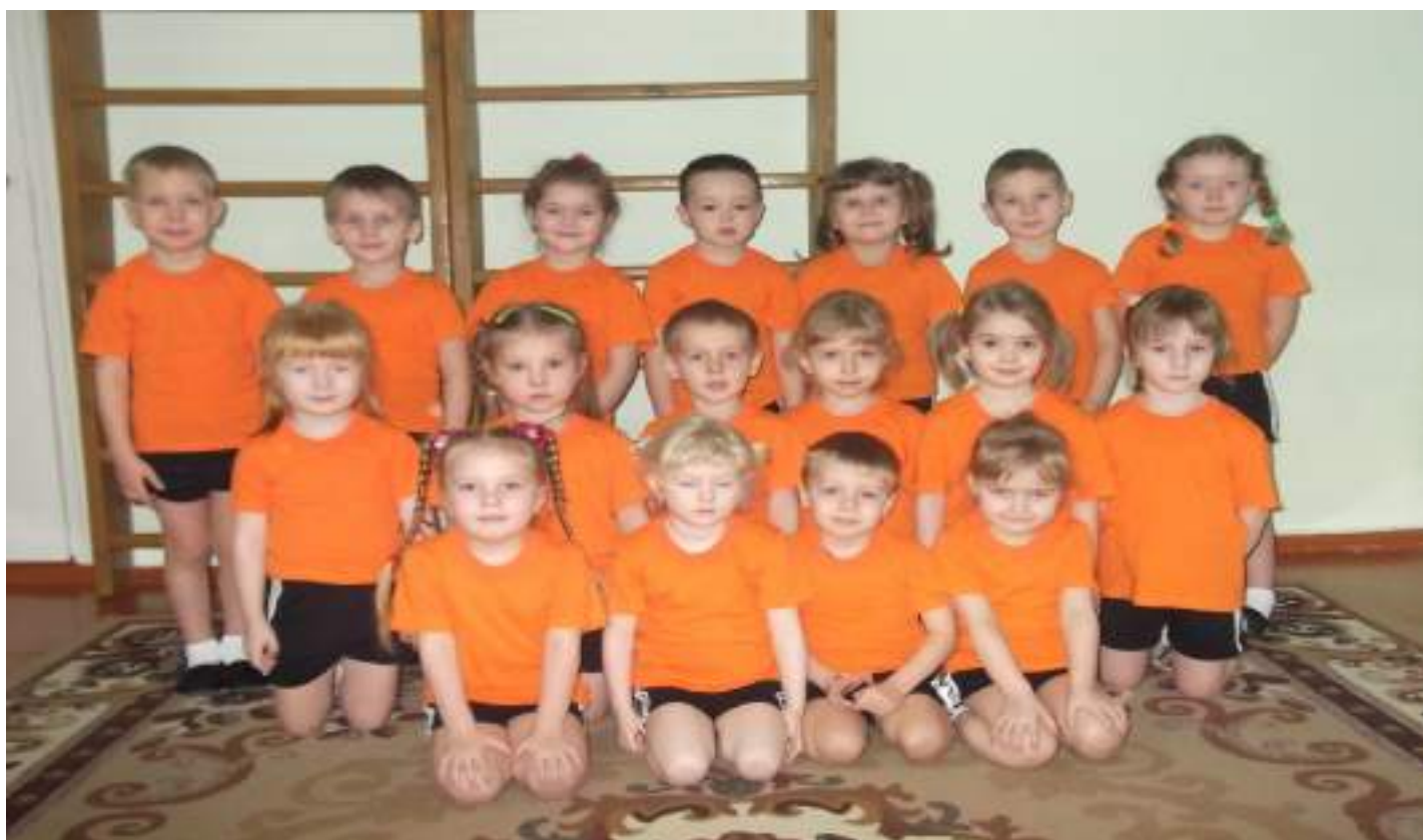
Фото № 1 (подгруппа детей)

В нашу жизнь стремительно вошли новые методы и технологии, которые далеко не всегда положительно сказываются на здоровье людей. Привычными стали тревожные данные о системном ухудшении состояния здоровья, снижении уровня физической и двигательной подготовленности детей дошкольного возраста.