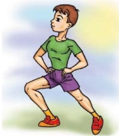
Рис.10 Упражнение «Заземлитель»

Стоя свободно, разведите ноги в стороны. Правую ступню направьте вправо, а левую прямо вперед. Выдох, согните правое колено; вдох – выпрямите правое колено. Во время упражнения плотно прижимайте руки к пояснице, это усиливает работу мышц пояса. Сделайте упражнение трижды, а потом повторите его по отношению к левой ноге (Рис.10).