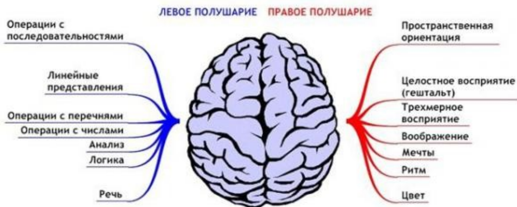
Рис.1. Функции левого и правого полушарий

Прежде чем перейти непосредственно к упражнениям, рассмотрим, как работает наш мозг, для этого условно разделим его на 4 части: левую и правую, переднюю и заднюю. Не вдаваясь в теоретический обзор, отметим только то, что нас будет интересовать. Левое полушарие мозга отвечает за управление правой половиной тела, а правое полушарие мозга - левой, то есть, когда мы действуем правой рукой активизируем левое полушарие, а когда двигаем левой рукой, то активизируем правое полушарие. То же самое касается глаз, ног и т.д. Так же левое полушарие отвечает за абстрактно-логическое мышление, а правое за пространственно-образное мышление. Когда мы анализируем, считаем и говорим, то более активно работает левое полушарие, а когда рисуем, фантазируем, танцуем и молчим – активно правое полушарие (Рис.1).