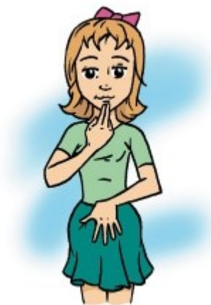
Рис. 7 Упражнение «Кнопки Земли»