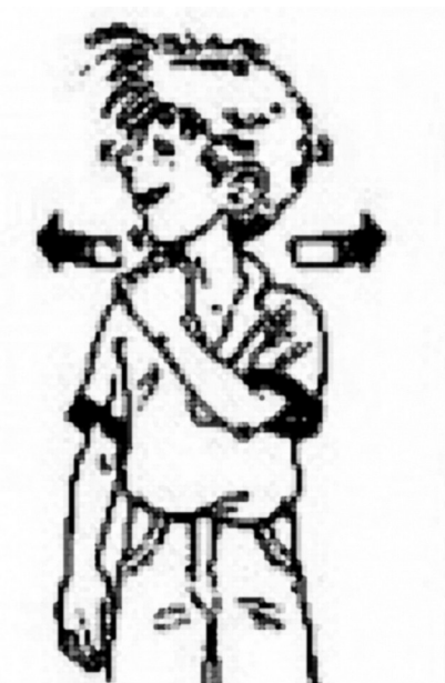
Рис.9 Упражнение «Сова»

Схватите и плотно сожмите мышцы правого плеча левой рукой. Поверните голову и посмотрите назад через плечо. Вдохните глубоко и разверните плечи. Посмотрите через левое плечо и распрямите плечи. Опустите подбородок на грудь и глубоко вдохните, расслабляя мышцы. Повторите то же самое, схватив левое плечо правой рукой (Рис.9).