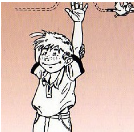
Рис.8 Упражнение «Активизация рук»