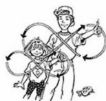
Рис.3 Упражнение «Ленивая восьмерка»