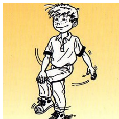
Рис.2 Упражнение «Перекрестные шаги»

Встаньте прямо, голова находится по средней линии тела. Одновременно поднимите вашу правую руку и левую ногу, легонько касаясь локтем руки левого колена. Затем верните руку и ногу в исходную позицию и поднимите левую руку и правую ногу, дотрагиваясь локтем левой руки до противоположного колена. Повторяйте эти движения в течение примерно минуты, как будто вы ритмично идете. Голова остается на месте (Рис. 2).