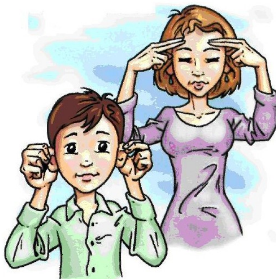
Рис.11 Упражнения «Позитивные точки», «Шляпа мышления»

спускайтесь постепенно вниз, до кончиков мочки уха. Повторяйте упражнение не менее трёх раз (Рис 11).