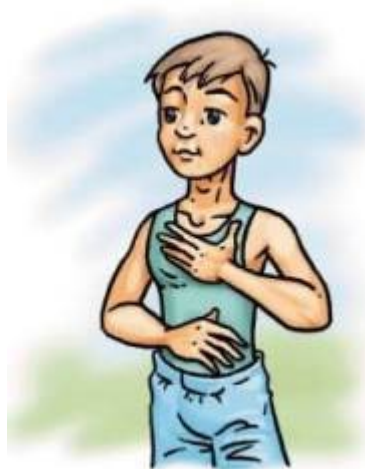
Рис.6 Упражнение «Кнопки мозга»

Положите правую руку на пупок, левую на нижнее основание ключицы по правую сторону от грудины. Массируйте левой рукой основание ключицы, держа другую руку на пупке. Повторите то же, переменяя руки (Рис.6).