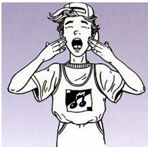
Рис.5 Упражнение «Энергетическая зевота».