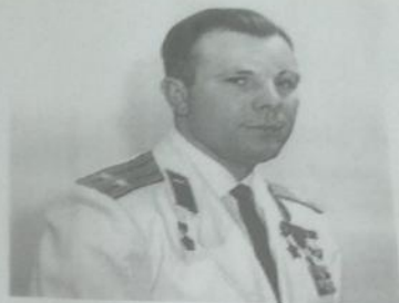
Юрий Алексеевич Гагарин (1934 - 1968)